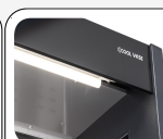
Luce interna LED