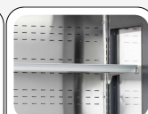
Ripiani in acciaio appoggiati su blocchi ancorati alle spalle